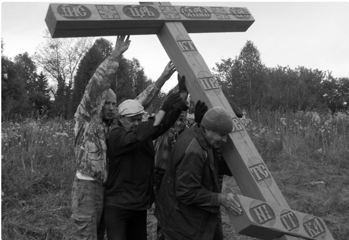
Установка поклонного креста на месте исчезнувшего села Таза. Сентябрь 2019 г.