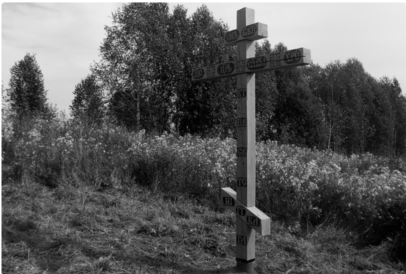
«Здесь была церковь...»