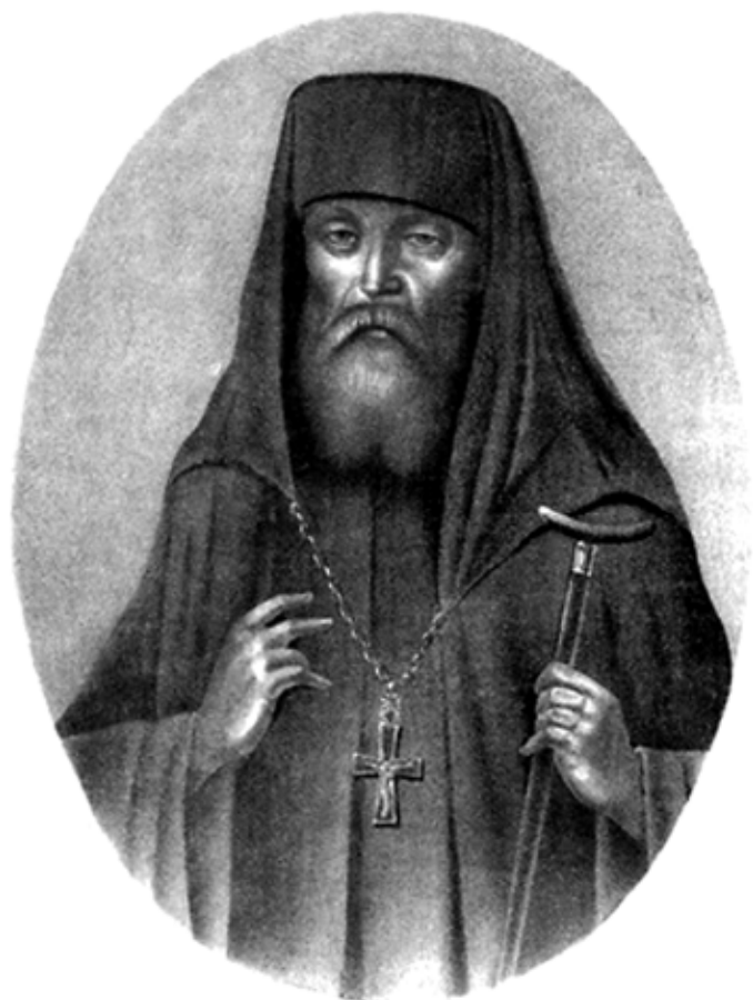
Портрет архимандрита Макария (Глухарёва). Литография. Около 1846 г. Копия. МАДМ

На праздновании 50-летнего юбилея Алтайской духовной миссии, 6 сентября 1880 года, начальник миссии, Преосвященнейший Владимир, епископ Бийский, во время богослужения в Майминской церкви сказал: «Здесь свою первую горячую молитву вознес отец Макарий за них ( жителей Алтая ), дабы Господь