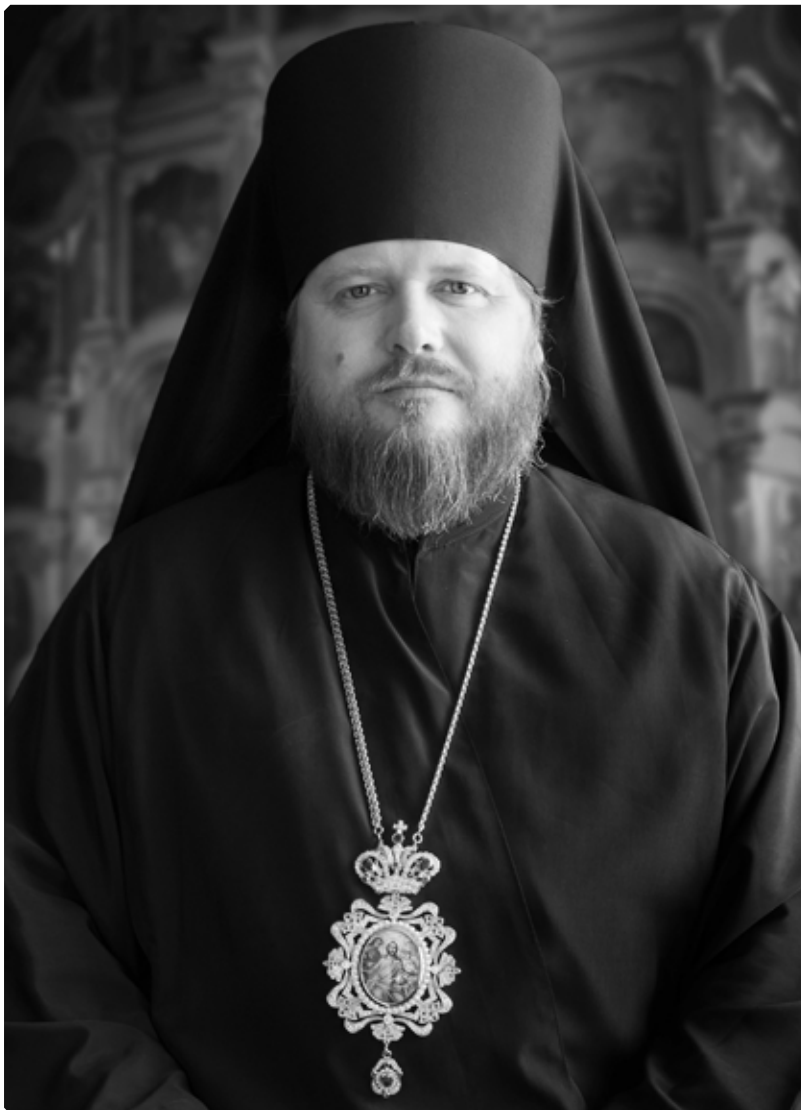
Преосвященный Серафим, епископ Бийский и Белокурихинский

Началу практической деятельности миссии предшествовал Указ Святейшего Правительствующего Синода от 27 мая 1829 года архиепископу Тобольскому и Сибирскому Евгению (Казанцеву), предписывающий «отправленного из Курской епархии архимандрита Макария обратиться по усмотрению Его Преосвященства на дело про-