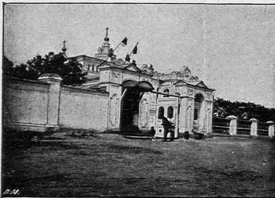
Бійскъ. — Архіерейскій домъ.

Опубликовано в «Томских епархиальных ведомостях». – 1910. – № 18. С. 762–763.