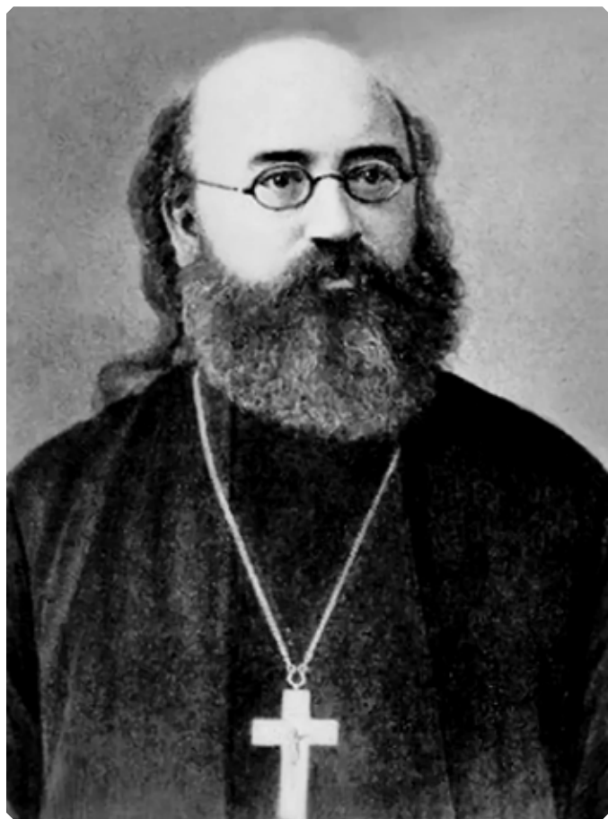
Организатор и участник Иркутского миссионерского съезда протоиерей Иоанн Иоаннович Восторгов

Приходское попечительство – учреждение, призванное заботиться о благоустройстве и благосостоянии храма и причта, обучении детей и благотворительности. Как сообщают нам «Томские епархиальные ведомости» в 18-м номере за 1892 год, именно в 1891 году Преосвя-