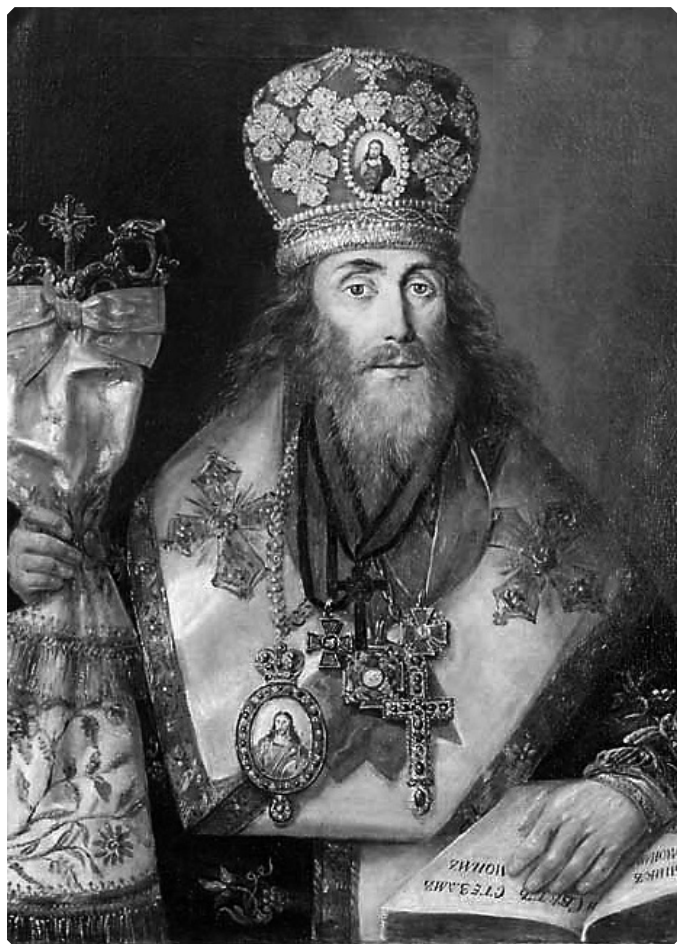
Высокопреосвященнейший Евгений (Казанцев), архиепископ Ярославский и Ростовский, (с 1825 по 1831 гг. – архиепископ Тобольский и Сибирский). 1840-е годы

очень высокие: они должны были владеть глубокими знаниями основ христианского вероучения, свободно говорить на инородческом языке, быть знакомыми с медициной, педагогикой, разбираться в естественных и сельскохозяйственных науках.