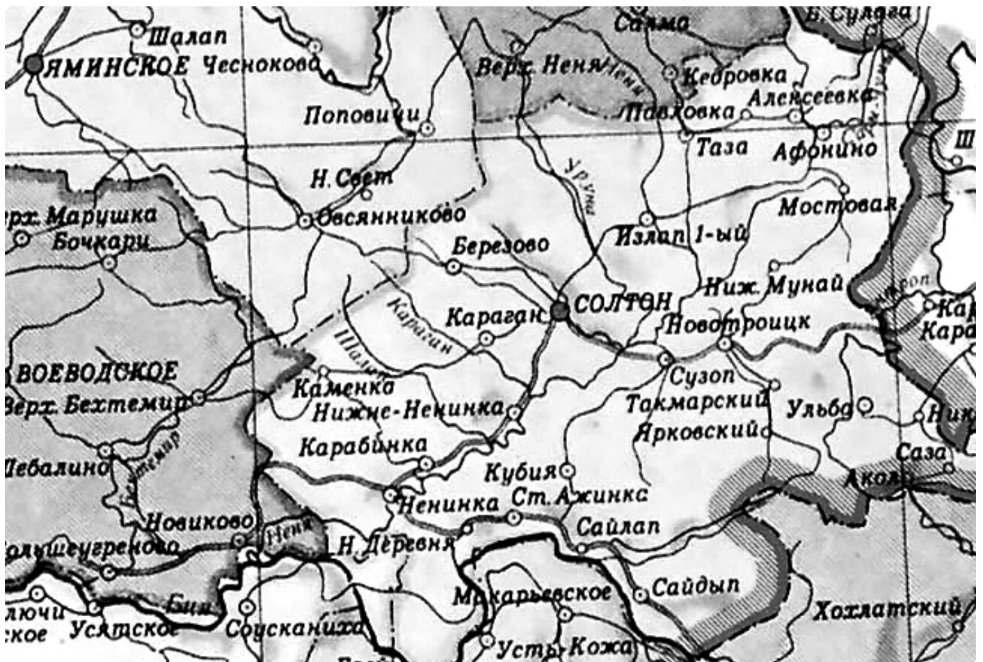
Одна из немногих карт, на которых сохранилось исчезнувшее ныне село Таза. Вырезка из «Карты Алтайского края». МВД СССР. Москва. 1955 г.

Во второй половине дня вернулись в Солтон. Вечером я просматривал в интернете материалы по репрессиям 1920–1950-х годов в Солтонском районе. Интересовали в первую очередь люди, пострадавшие за православную веру. Вспомнил, что на сайте Алтайской митрополии есть список репрессированных священнослужителей Алтайского края. К этому времени мои мысли были далеки от утренних событий. Нашел список репрессированных. По каждому человеку указаны имя, фамилия, отчество, даты жизни и место служения. Список составлен в алфавитном порядке. Просматриваю, встречаю знакомых уже священников, служивших в Солтонском районе. Подхожу к концу списка. На букву «Щ» читаю: «Щербаков Алексей Фролович (1876–1931), служил в пос. Таза Солтонского района».