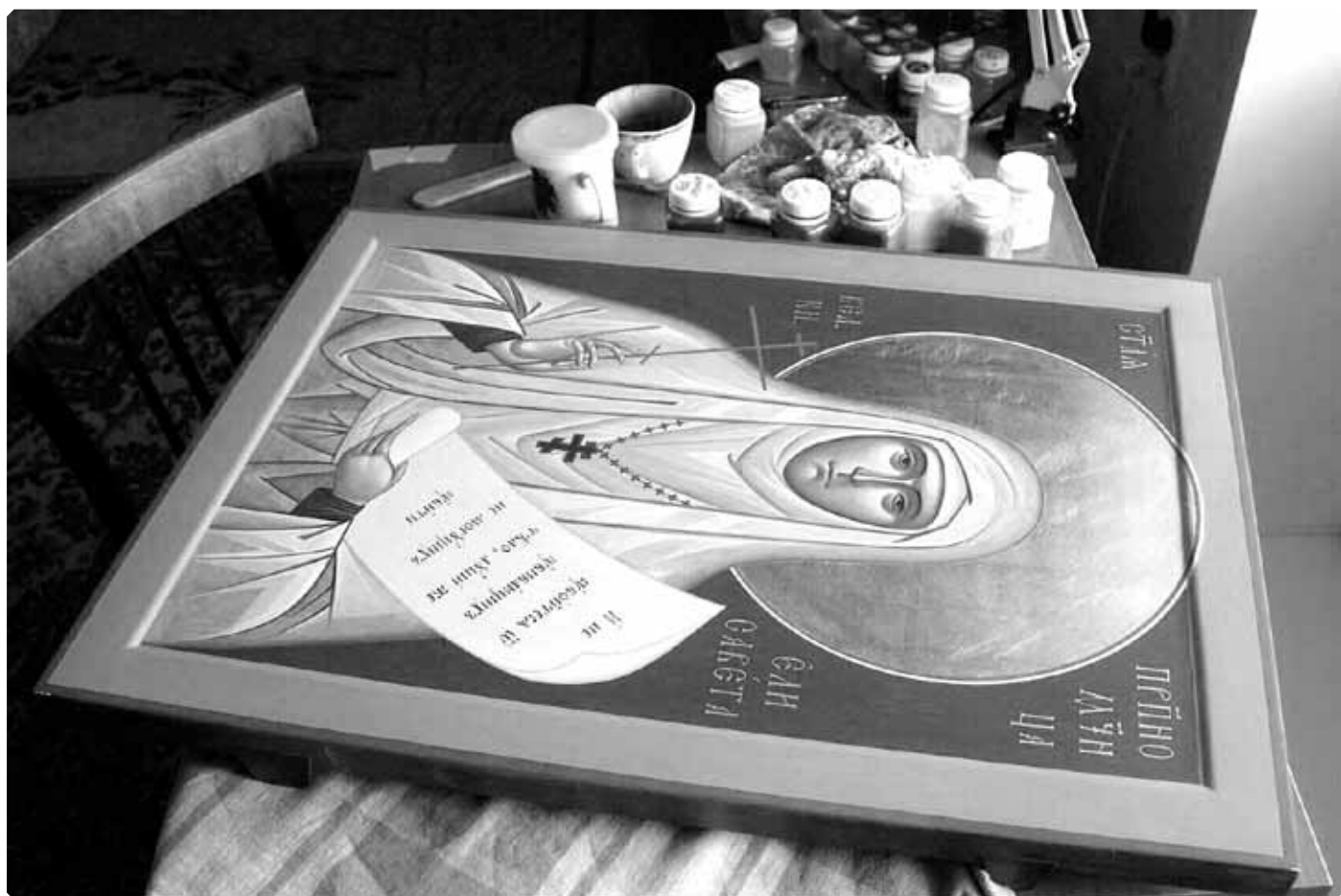
Завершение работы над иконой святой преподобномученицы великой княгини Елисаветы