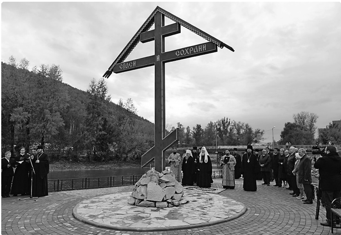
Освящение Святейшим Патриархом Московским и всея Руси Кириллом поклонного креста на месте первого крещения преподобным Макарием (Глухарёвым) жителя Горного Алтая. г. Горно-Алтайск. 20 сентября 2015 года

просветил их, находившихся во тьме языческой, светом Своего учения. Здесь капнула за них первая слеза Макария, здесь взлетел его первый вздох. Здесь посеяно отцом Макарием то первое семя, которое в продолжение пятидесяти лет выросло в огромное дерево с такими обильными плодами, которые видны каждому воочию». Плоды действительно были налицо: почти все молящиеся в тот день в Майминской церкви являлись, по свидетельству очевидцев, детьми и внуками крещенных отцом Макарием алтайцев, не крещенных же не было к тому времени ни в Майме, ни далеко за ее пределами. В заключение своего слова бийский Архипастырь призвал всех молиться о душе незабвенного отца Макария, чтобы молитвенная память о нем передавалась из рода в род.